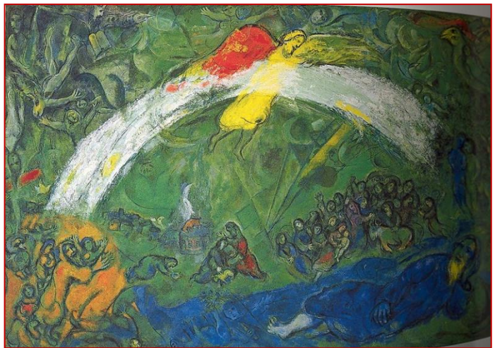
Marc Chagall, Noè e l'arcobaleno

Fu certamente in uno di quegli incontri con la Madonna che egli prese la sua decisione: la Madonna, scendendo dal suo Trono, era apparsa a tutti particolarmente raggianti. Sulla Terra si accendeva in quel momento quella bella giornata di aprile.