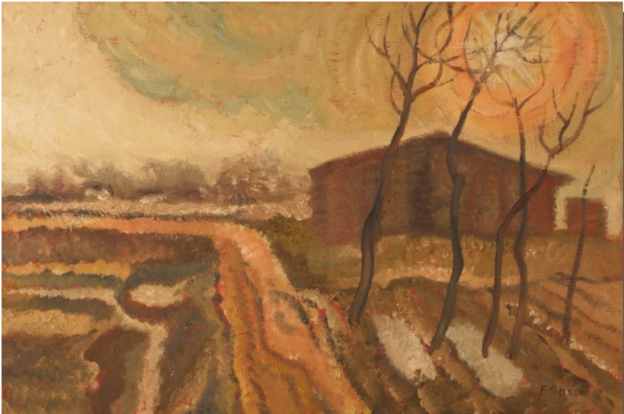
Ap 3,3 - Ricorda dunque come hai ricevuto e ascoltato la Parola, custodiscila...