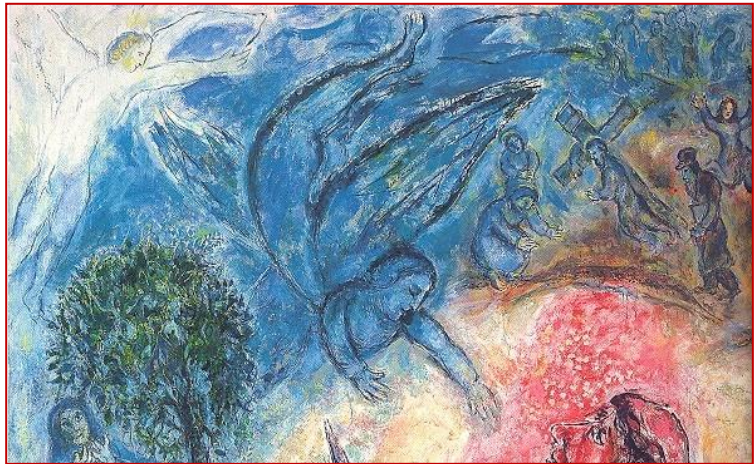
Marc Chagall - Il sacrificio di Isacco (dettaglio)

Nonostante tutto Egli amava ancora la Terra e i suoi abitanti (come si può non amare il proprio sogno?) e, dopo che con un enorme sforzo di volontà era riuscito, almeno per un giorno, a risollevarli dalla loro miseria, evitò di esporsi a nuove delusioni ed evitò all'Umanità di correre altri rischi. Avvenne così che mentre i grandi giocavano, come sappiamo, con i bimbi - pentendosi in cuor loro degli atteggiamenti fino ad allora tenuti e rammaricandosi di tutte le occasioni di gioia che avevano perduto -