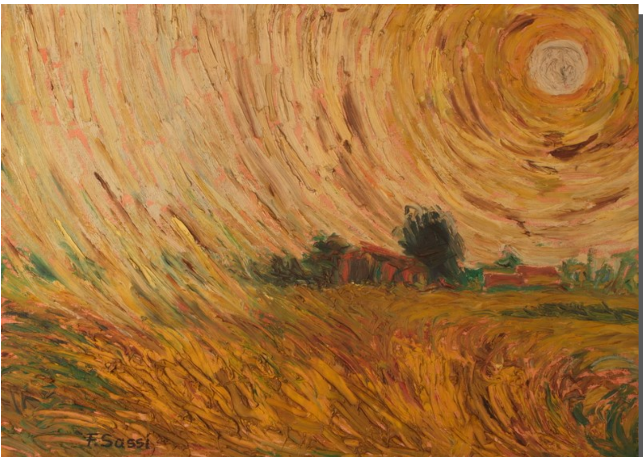
Ap 2,23 - Io sono colui che scruta gli affetti e i pensieri degli uomini e darò a ciascuno secondo le sue opere