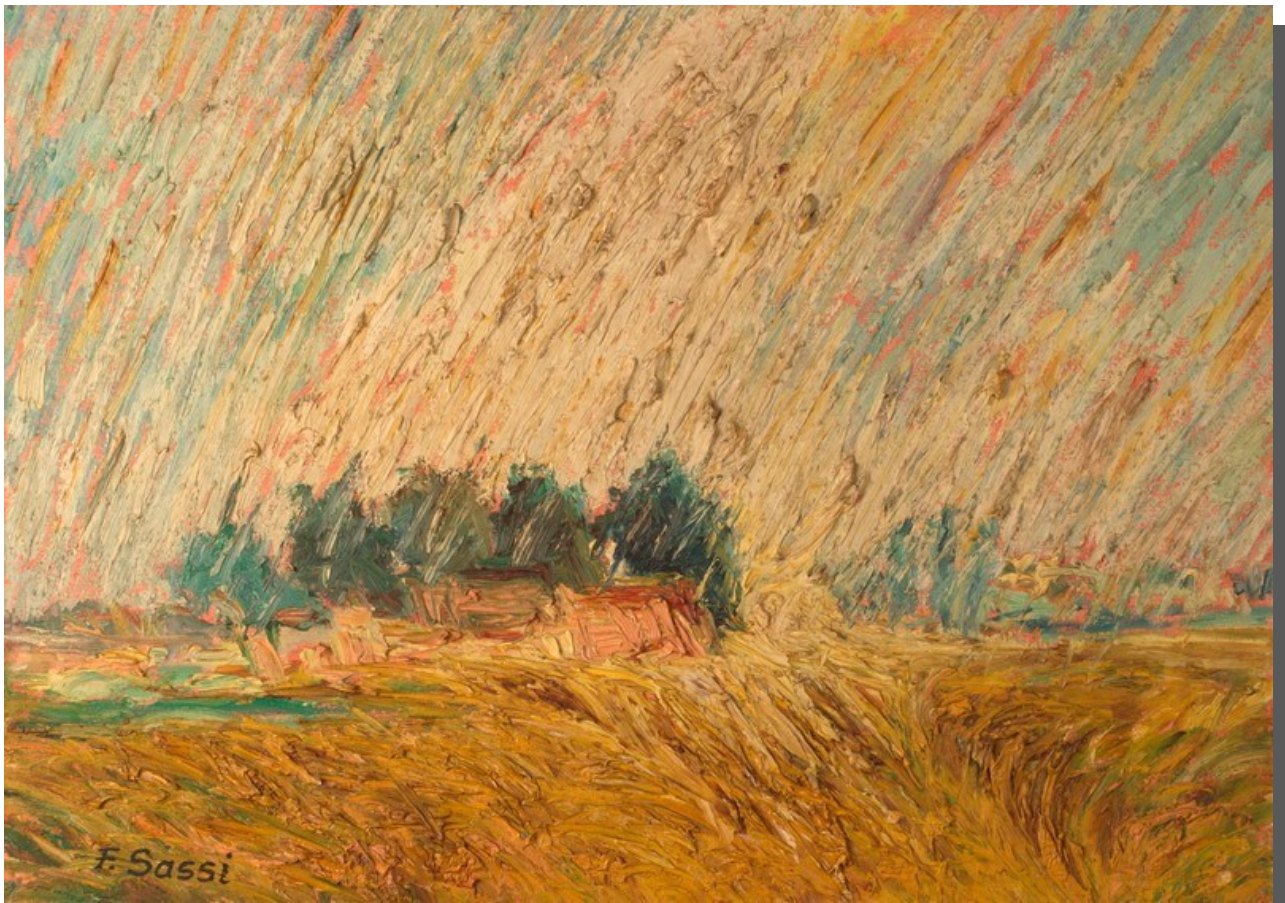
Ap 2,2 - Conosco le tue opere, la tua fatica e la tua perseveranza...