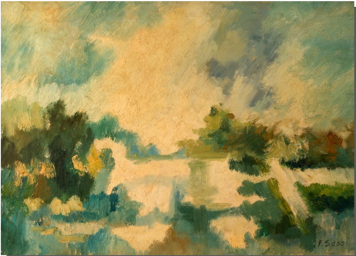
Ap 2,17 - Al vincitore darò la manna nascosta...