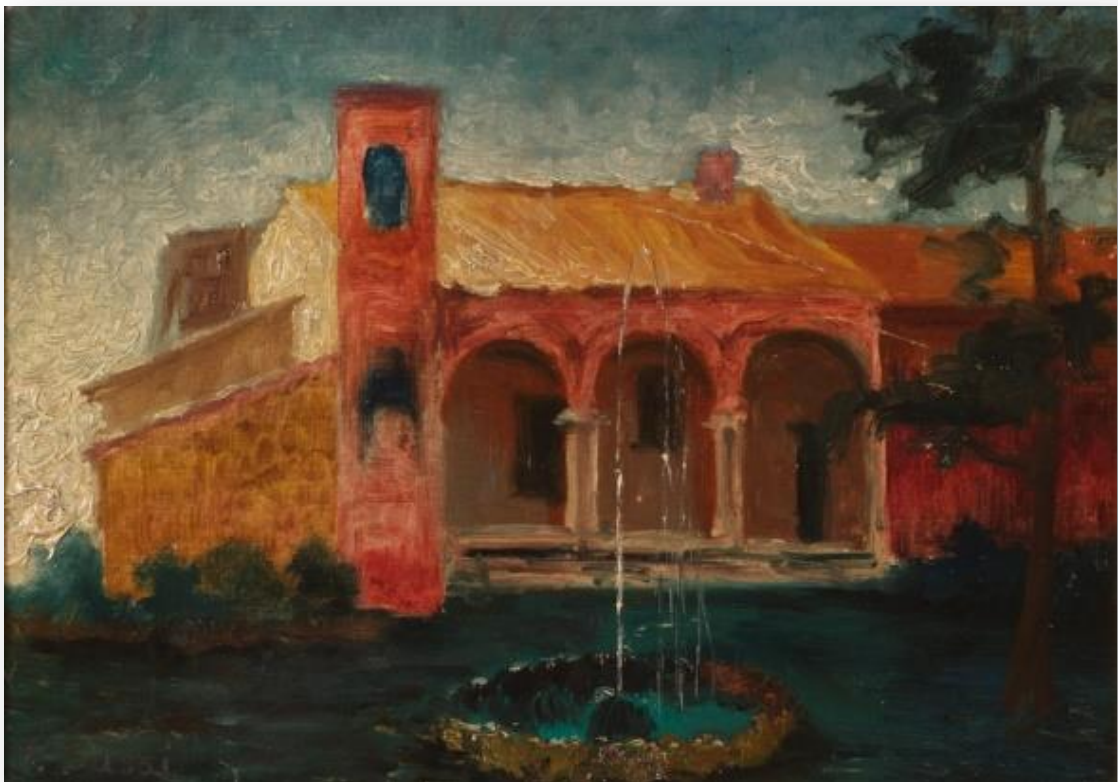
Ap 3,8 - Ecco, ho aperto davanti a te una porta che nessuno può chiudere