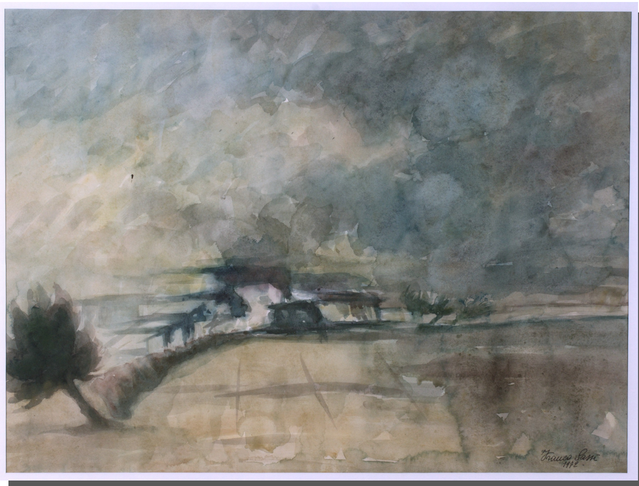
Ap 2,10 - Non temere ciò che stai per soffrire