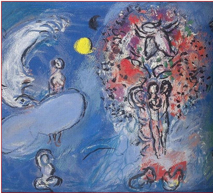
Marc Chagall, Il Paradiso

Quel giorno dunque gli uomini si svegliarono un po' meno infelici, e la limpidezza dell'aria e la mitezza della temperatura li aiutarono a provare di nuovo a sorridere. Man mano che il giorno avanzava, un senso di serena letizia si spandeva per l'aria e il cuore degli uomini cominciò a provare persino una contenuta euforia. Quel giorno sembrava così facile esser più buoni che qualcuno cominciò a provarci e subito a prenderci gusto. E molti si chiedevano come mai non ci fossero riusciti prima, ma prima non lo avevano neppur desiderato. I bambini dagli occhi smarriti pian piano uscirono all'aria aperta e sotto il sole di mezzogiorno (non lo avevano visto mai così sfolgorante) desiderarono la gioia dei giardini e dei prati. Allora avvenne un vero miracolo, anzi qualcosa che fece comprendere come tutto quello che stava accadendo fosse un miracolo. L'erba verde cominciò a spaccare l'asfalto e ben presto nelle squallide piazze cittadine fiorirono prati; nelle campagne fiorirono gli alberi, tutti, improvvisamente, e tutti bianchi. E questo stava avvenendo contemporaneamente in ogni parte della Terra, quale che fosse il clima e la latitudine.